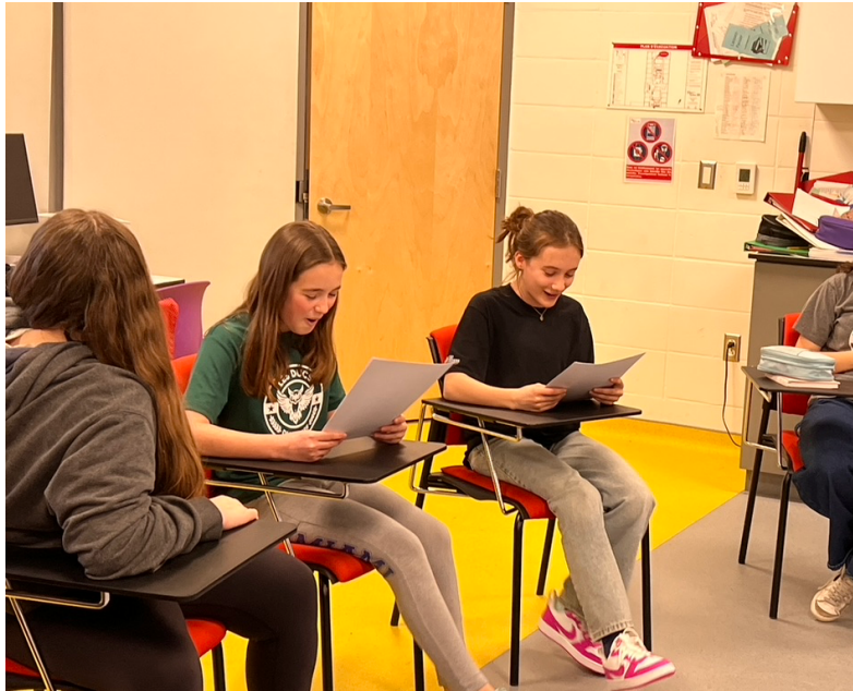
Figure 4.1 Lecture de Sous influences à l'école du Havre

Les deux autres courtes formes sont appréciées de la plupart des élèves. La personnalité des personnages et l'humour dans La story de mamie s'alignent avec les goûts humoristiques des participants et participantes. Plusieurs s'identifient au personnage de l'ado. Le père tolérant et candide leur plaît aussi, mais c'est la grand-mère qui l'emporte en gagnant le cœur des participants et participantes. Les élèves trouvent surprenants et amusants son expression fétiche (Tabasco), le vol de bonbons, le fait qu'elle se fasse passer pour plus vulnérable qu'elle ne l'est et qu'elle ne corresponde pas à l'image des personnes âgées présentées habituellement dans les pièces de théâtre. Ils et elles aiment la présence d'autres types de personnages que ceux d'adolescents ou adolescentes et la moindre fréquence de leurs expressions dans ce texte.