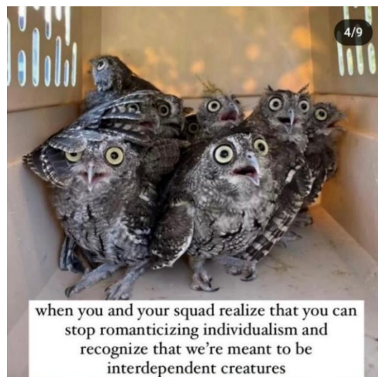
Figure 1 - meme publié sur le compte d'Abigail. Capture d'écran prise par la chercheuse le 25 septembre 2023.

message. Le meme ci-bas, où Abigail remet en question le narratif individualiste selon lequel nous pouvons exister de manière indépendante les un·e·s des autres, en est un bon exemple :