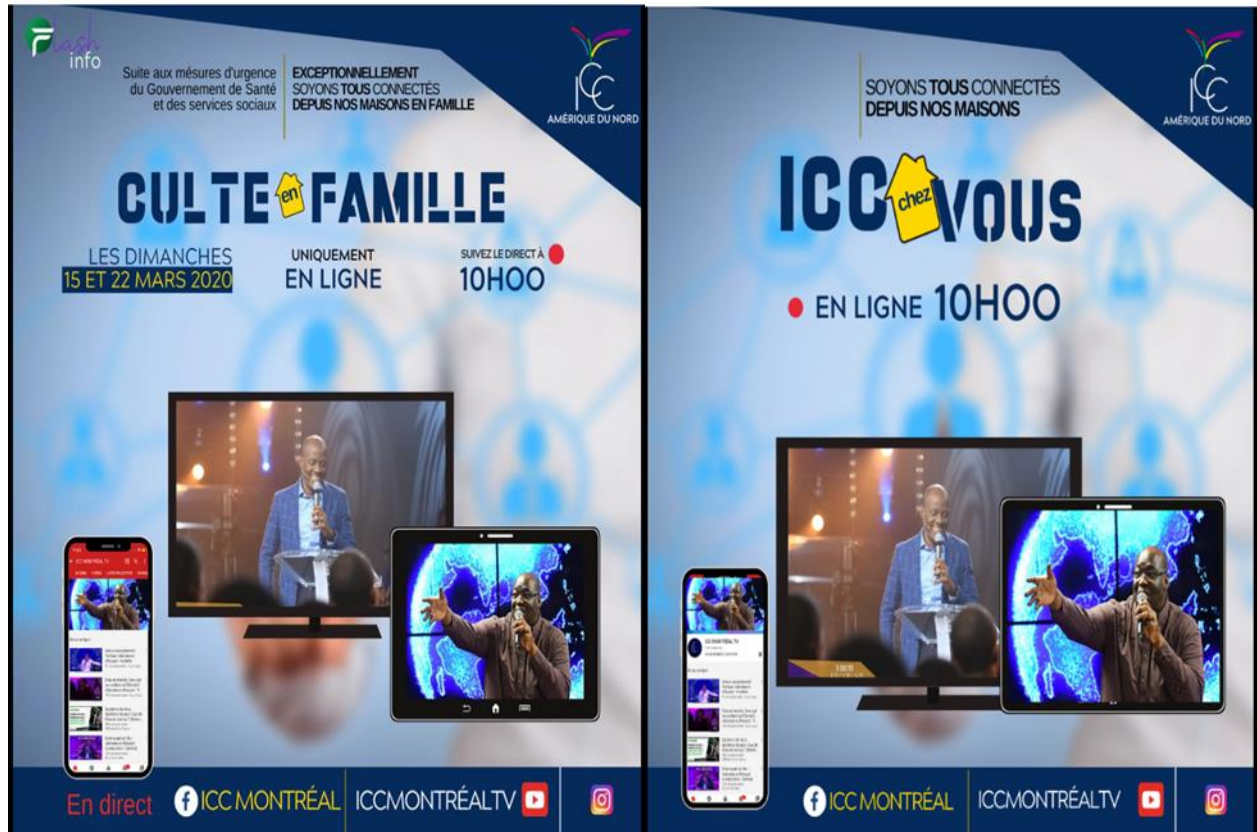
Figure 4.6 : Premières mesures pour le « online » suite au déclenchement des mesures sanitaires le 13 mars 2020