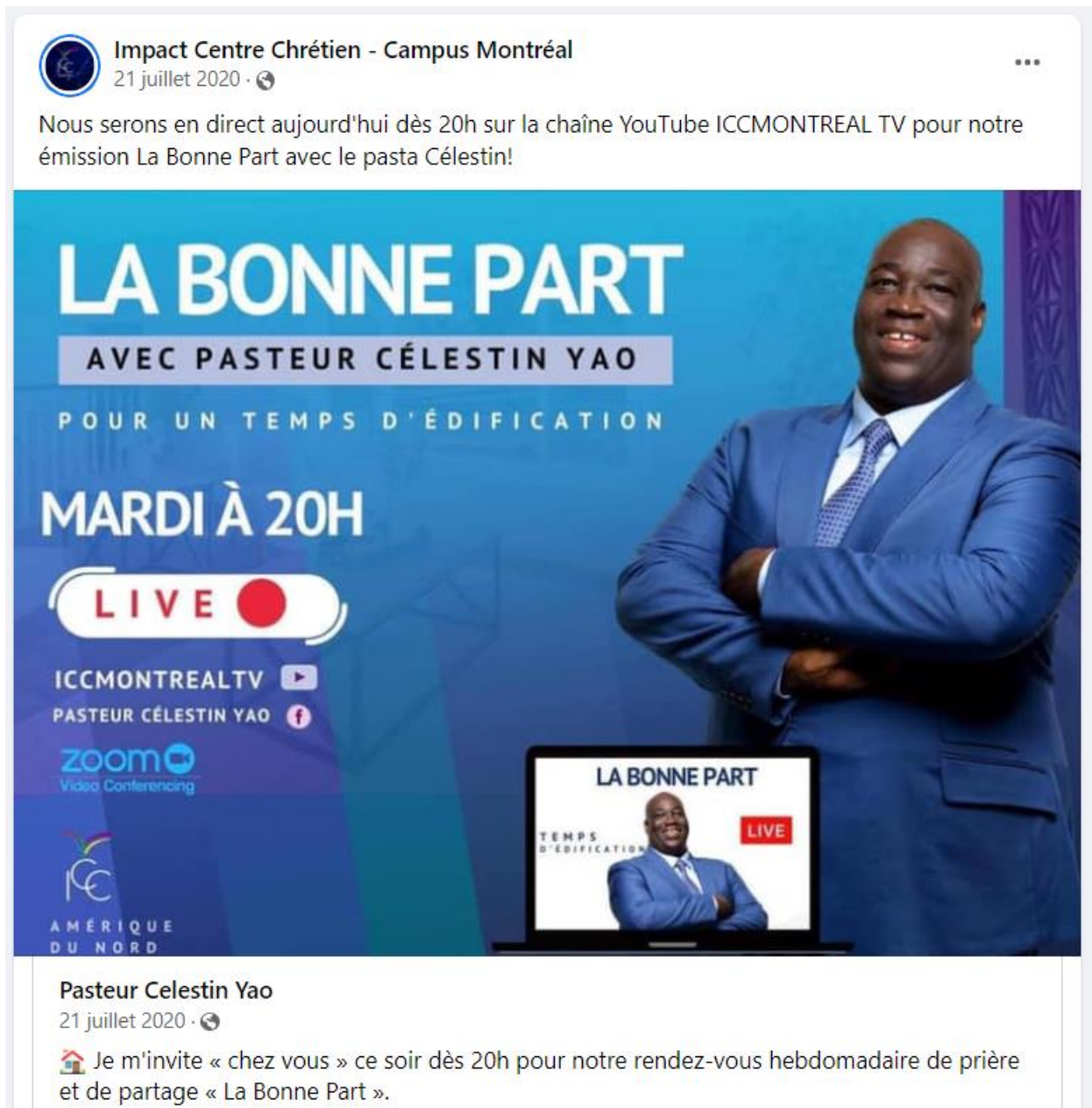
Figure 2.3 : Fiche publicitaire d'invitation de la nouvelle plateforme « La Bonne Part » en pleine Covid-19