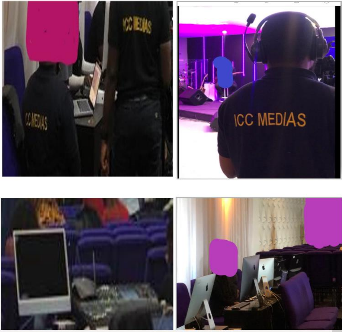
Figure 4.1 : Équipe audiovisuelle (MCIM) en plein travail et matériel audiovisuel