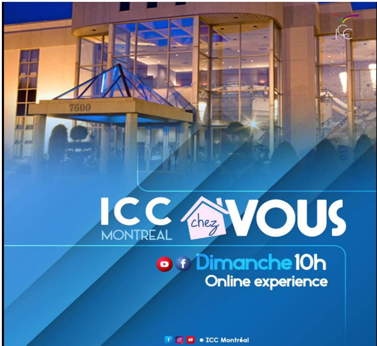
Figure 4.8 : Dieu en ligne (ICC chez vous), en image

Réalisation et crédit photo : Samuel W Tompoudi 7. Source : (Impact Centre Chrétien, 2022) et (FB ICC-Montréal, 2022).