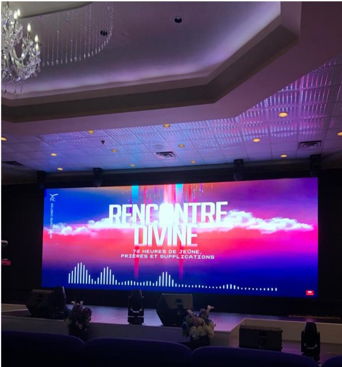
Figure 4.2 : Écran géant qui a remplacé pendant la Covid-19 les 4 mini-écrans jumelés

Réalisation et crédit photo : Samuel W Tompoudi. Source : page site de l'Église (Impact Centre Chrétien, 2022) et (FB ICC-Montréal, 2022)