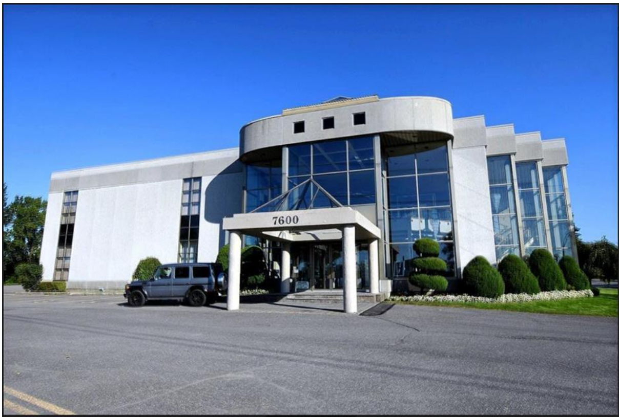
Figure 3.1 : Le nouveau bâtiment principal de ICC-Montréal

Réalisation et crédit photo : Samuel W Tompoudi. Source : page Facebook ICC-Montréal (2022).